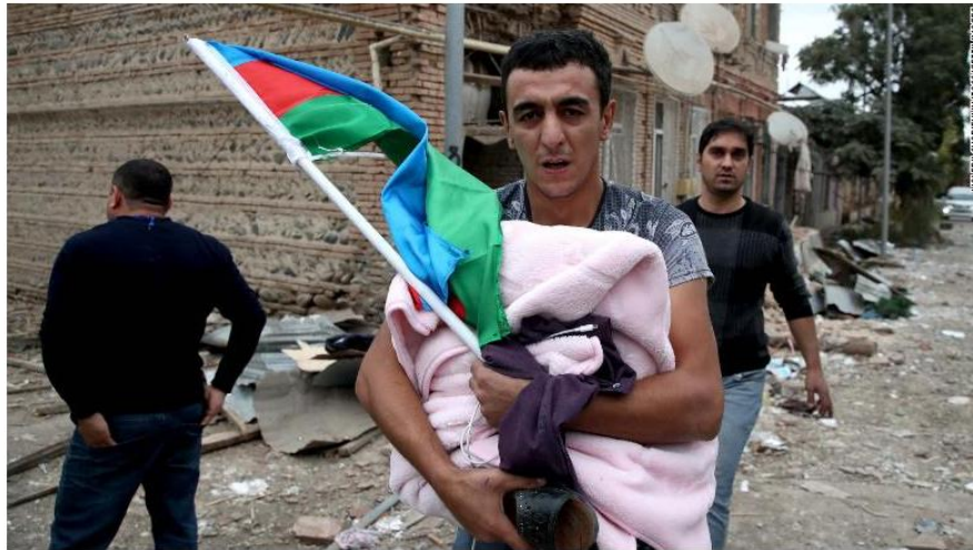
A man brings out his belongings after his house was shelled in Gyandzha, Azerbaijan.

Updated 0147 GMT (0947 HKT) October 14, 2020